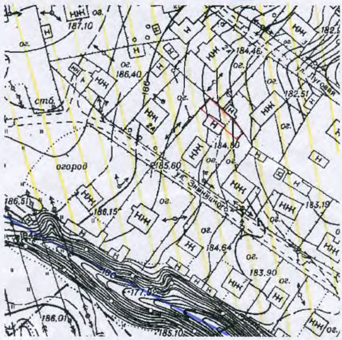
Схема расположения земельного участка на кадастровом плане (карте) территории кадастровый квартал 67:22:0020126

Утверждена: Постановлением Администрации муниципального образования "Хвстлавичский район" от 12.07.2016 № 240