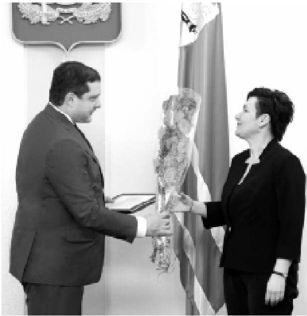
Конкурс "Учитель года" проводится на Смоленщине в 26 раз. В этом году он собрал 16 участников из 12 муниципальных районов и городских ок-

Обращаясь к участникам конкурса, глава региона отметил: "Если 20-30 лет назад школьный учитель являлся для ученика практически единственным источником получения знаний, то сейчас всем вам приходится работать в условиях крайне высокой конкурентной среды, ведь источников информации стало гораздо больше. Но в то же время Интернет и современные СМИ, предоставляющие колоссальный объем информации, не могут сравниться с той работой по духовно-нравственному воспитанию, которую вы проводите, наравне с родителями, а, зачастую, к сожалению, только вы одни. Этот процесс воспитания души, личности, и в конечном итоге, гражданина невозможно ничем компенсировать. Я уверен, что все вы достойны самых высоких наград, но самыми важными из них, вне всякого сомнения, являются любовь, уважение и успехи ваших учеников".