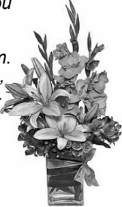
С любовью, дочь, зять

Своим теплом и лаской материнской Ты согреваешь наш семейный быт. Хотим тебе мы низко поклониться За добрый труд, что нами не забыт. Без сна ночей твоих прошло немало, Забот, тревог за нас не перечесть. Земной поклон тебе, родная мама, За то, что ты на свете есть. Жить желаем замечательно, Быть здоровой обязательно, Уважаемой, любимой, В жизни радостной, счастливой.