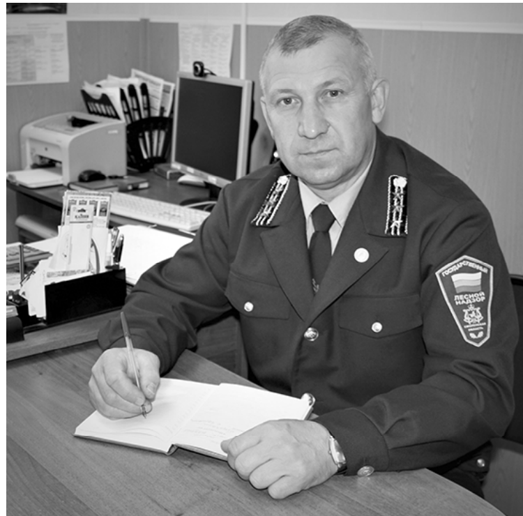
В преддверии профессионального праздника грамотой Департамента Смоленской области по охране, контролю и

Каждый госинспектор, работающий в лесничестве, профессионально и пристально следит за состоянием наших лесов, использованием лесного фонда, выполнением мероприятий по восстановлению, обеспечению пожарной безопасности, сохранности.