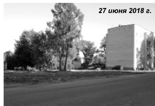
27 июня 2018 г.

Тем более, не масштабными, а такими локальными. Это входит исключительно в сферу Ваших полномочий как главы районной администрации. И Губернатор, в принципе, не должен решать подобные задачи.