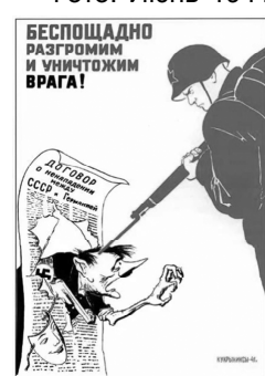
Фото: Июнь 1941 г. Первый советский плакат.

В первые дни вышла и первая советская листовка: "Долой грабительскую войну, развязанную Гитлером! Да здравствует дружба немецкого и русского народов!"