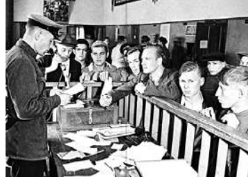
Фото: 23.06.1941г. Первый день мобилизации в РККА.

23 июня 1941 г. вышло постановление о создании Ставки Главного Командования Вооруженных сил СССР. Главный Военный совет Красной Армии был упразднен. Вместо него создана Ставка Главного Командования Вооруженных сил СССР (председатель С. Тимошенко). 10 июля она будет преобразована в Ставку Верховного Командования (председатель И. Сталин), а 8 августа переименована в Ставку Верховного Главного Командования.