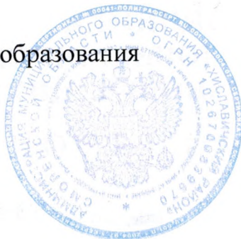
А. В. Загребаев

Глава муниципального образования «Хиславичский район» Смоленской области