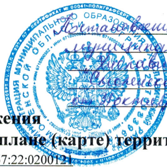
Схема расположения земельного участка на кадастровом плане (карте) территории кадастровый квартал 67:22:020012