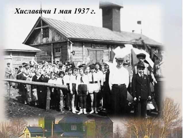
Хиславичи 1 мая 1937 г.

В нынешних границах Хиславичский район ведет свою историю с марта 1929 года. За время Советской власти он экономически окреп и вырос, имея богатую сырьевую и промышленную базу, а районный центр превратился в рабочий поселок.