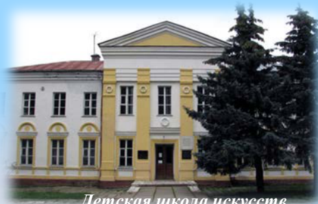
Детская школа искусств

административный и культурный центр муниципального образования Хиславичский район,