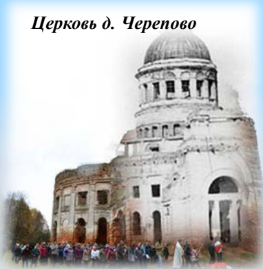
Церковь д. Черепово

свою пятнадцатилетнюю историю показал это. Он стал поистине масштабным проектом, который с каждым годом расширяет свои границы, привлекая новые, яркие таланты, укрепляя дружбу наших братских народов.