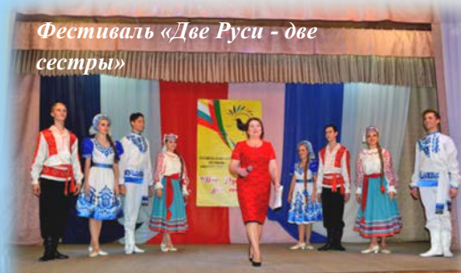
Фестиваль «Две Руси - две сестры»

свою пятнадцатилетнюю историю показал это. Он стал поистине масштабным проектом, который с каждым годом расширяет свои границы, привлекая новые, яркие таланты, укрепляя дружбу наших братских народов.