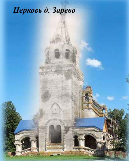
Церковь д. Зарево

Территорию Хиславичского района можно отнести к «старому» новому пограничью России на ее западных рубежах, которая являлась при этом скорее взаимодействием, чем барьером. Международный фестиваль народного творчества «Две Руси - две сестры», традиционно проводимый в нашем поселке, за