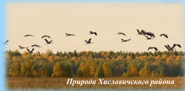
Природа Хиславичского района

В XVIII - XIX веках Хиславичи являлись наиболее населенным и промышленным местом Мстиславского уезда. Торговому оживлению поселка способствовала ежегодная