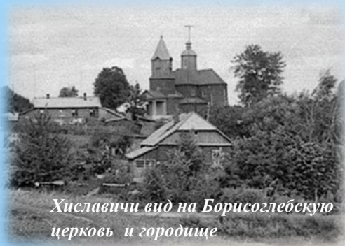
Хиславичи вид на Борисоглебскую церковь и городище

Археологические памятники современных Хиславич позволяют высказать мнение, что населенный пункт здесь возник гораздо раньше, как минимум в XII-XIII вв. Об этом свидетельствуют городище расположенное на правом берегу реки Сож и курганная группа юго-западнее.