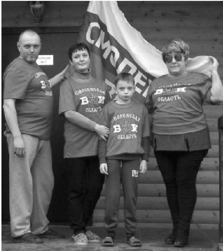
В течение трех дней участники конкурса соревновались в умении готовить, вышивать, демонстрировали свою любовь,