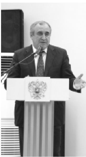
Смоленское региональное отделение Всероссийской политической партии «ЕДИНАЯ РОССИЯ»

Коллеги, я хочу напомнить главные принципы предварительного голосования, его суть. Об этом не раз говорил Президент Владимир Владимирович Путин, который основал "Единую Россию" и Председатель Партии Дмитрий Анатольевич Медведев. Доверие к предварительному голосованию, легитимность процедуры - приоритет, все попытки применения административного ресурса, давления будут фиксироваться, и в случае выявления таких действий будут аннулированы результаты по этим участкам и даже по округам. Эти правила одинаковые для всех, независимо от того, кто какую должность занимает, у кого какой статус. Этим не надо прикрываться. Все равны. Поэтому у каждого