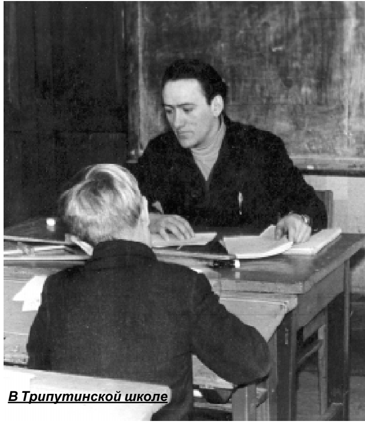
В Трипутинской школе