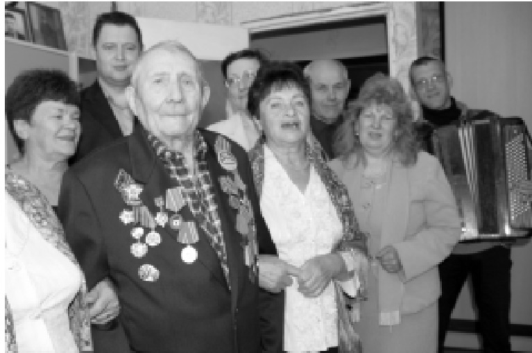
открытка" побывали 7 мая с праздничным визитом у семи хиславичан.